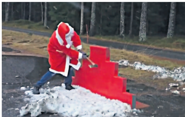
BAD SANTA VS. PLASTVEGG: Men foreløpig ikke flere enn rundt 80 visninger.